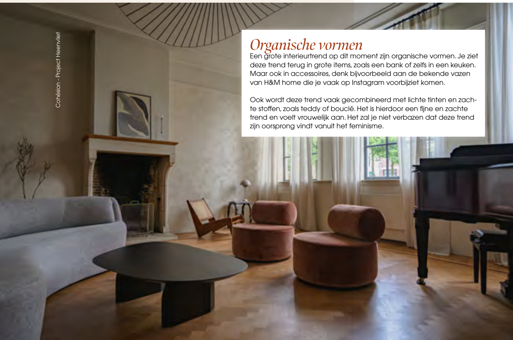
Cohésion - Project Heenvliet

Organische vormen Een grote interieurtrend op dit moment zijn organische vormen. Je ziet deze trend terug in grote items, zoals een bank of zelfs in een keuken. Maar ook in accessoires, denk bijvoorbeeld aan de bekende vazen van H&M home die je vaak op Instagram voorbijziet komen. Ook wordt deze trend vaak gecombineerd met lichte tinten en zachte stoffen, zoals teddy of bouclé. Het is hierdoor een fijne en zachte trend en voelt vrouwelijk aan. Het zal je niet verbazen dat deze trend zijn oorsprong vindt vanuit het feminisme.