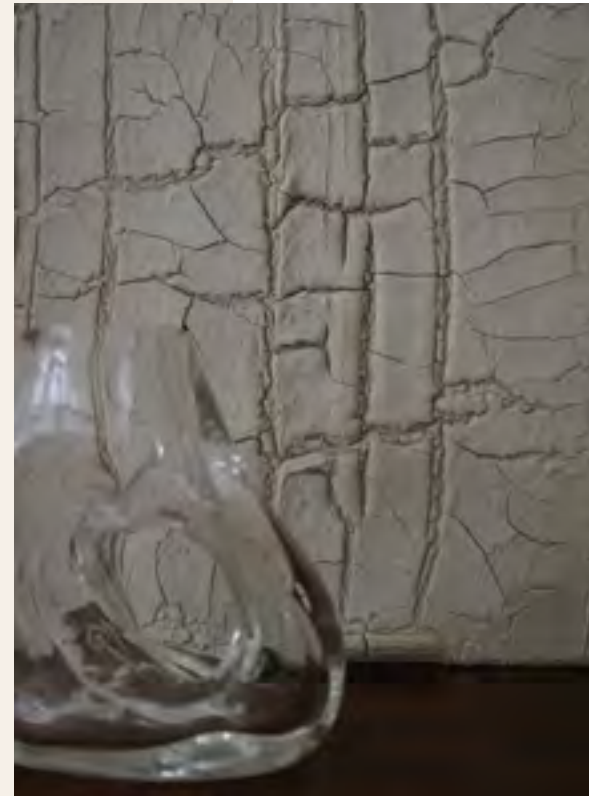
Glazen vaas van Studio Yen, in organische vorm, bij Cohésion - Project Amsterdam

We komen uit een onzekere tijd, waarbij eigenlijk niemand goed wist waar hij/zij aan toe was en hoe lang het zou duren. Ik heb het natuurlijk over de pandemie. Glas is helder en dit is precies waar mensen nu behoefte aan hebben. Daarom is dit één van de trends die voorkomt vanuit de pandemie, die hoe dan ook, op ons allen effect heeft gehad.